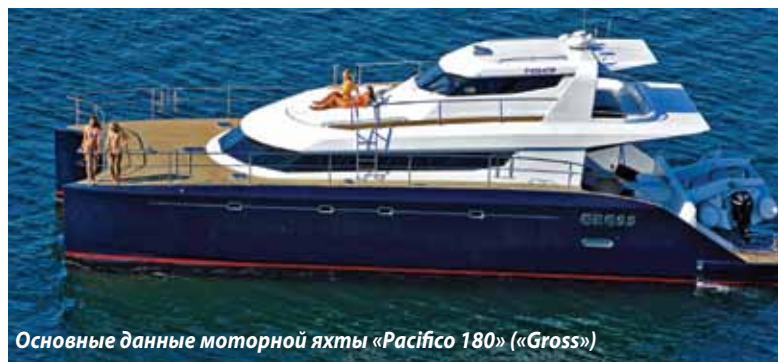
Основные данные моторной яхты «Pacifico 180» («Gross»)

Длина – 18 м, ширина – 7,4 м, осадка – 1 м, водоизмещение порожнем – 17 000 кг, водоизмещение полное – 20 100 кг, запас топлива – 1300 л, запас воды – 1800 л, двигатели: «Yanmar», 2×315 л.с., скорость максимальная – 22 уз, скорость крейсерская – 18 уз