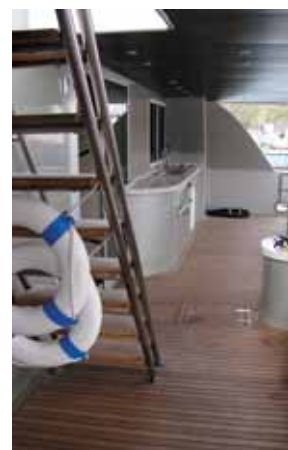
По кормовому кокпиту можно прогуливаться, как по веранде с видом на море

торые обходятся без наклонных гребных валов и поддерживающих их кронштейнов.