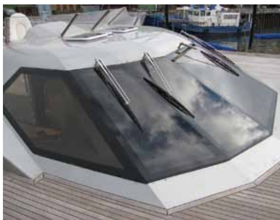
Рулевая рубка в стиле «стелс» вторит футуристическому облику судна