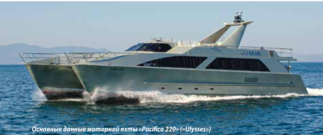
Основные данные моторной яхты «Pacifico 220» («Ulysses»)

Длина – 22 м, ширина – 10 м, водоизмещение порожнем – 40 950 кг, водоизмещение полное – 48 950 кг, запас топлива – 4000 л, запас воды – 2000 л, двигатели – «Caterpillar» 2×600 л.с., скорость максимальная – 25 уз, скорость крейсерская – 20 уз.