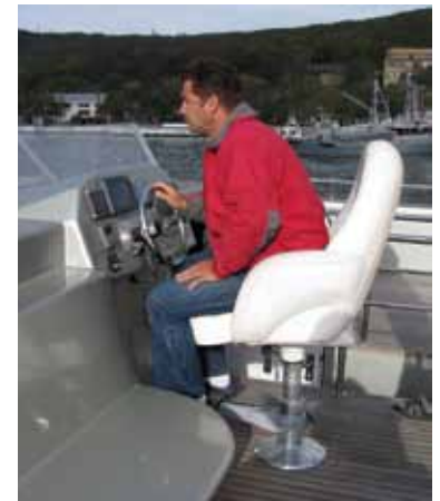
Верхний пост управления «Ulysses» кажется совсем маленьким на его огромной верхней палубе

определялась заказом, но можно предположить, что в данном размере судна она будет типовой. Эргономичности планировки в первую очередь способствует очень немалая, присущая катмаранам, ширина в 7.4 м. Отдельный вход в помещения каждого «класса» через просторный, сообщающийся напрямую с кокпитом камбуз логичен: это уменьшает толчею, когда на борт поднимаются все пассажиры, допускаемые вместимостью. По полезной площади «нутро» яхты тянет на пятизвездные апартаменты. Сходство усиливают керамика в отделке санузлов, «домашняя», незакрепленная мебель в хорошо освещенном салоне и мягкий ворс палубного покрытия кают и салона. Отчетливо заметна разница в комфорте между каютами владельца и гостей, видно