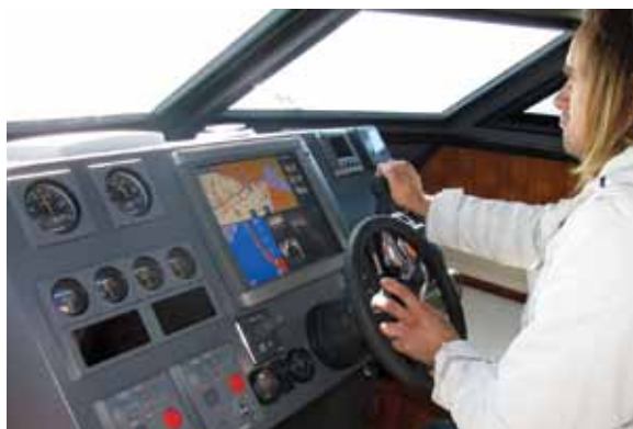
Панель управления проста, но информативна, и, что немаловажно, не бликует в наклонном стекле

Зависимость скорости катамарана «Gross» от частоты вращения двигателя. Она почти линейна, но с заметным «провалом» на средних оборотах.