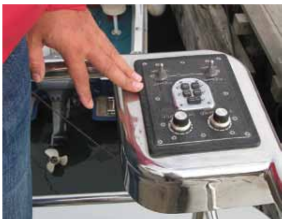
Значительная ширина судна требует размещения на обоих бортах таких мини-постов управления двигателями для маневрирования