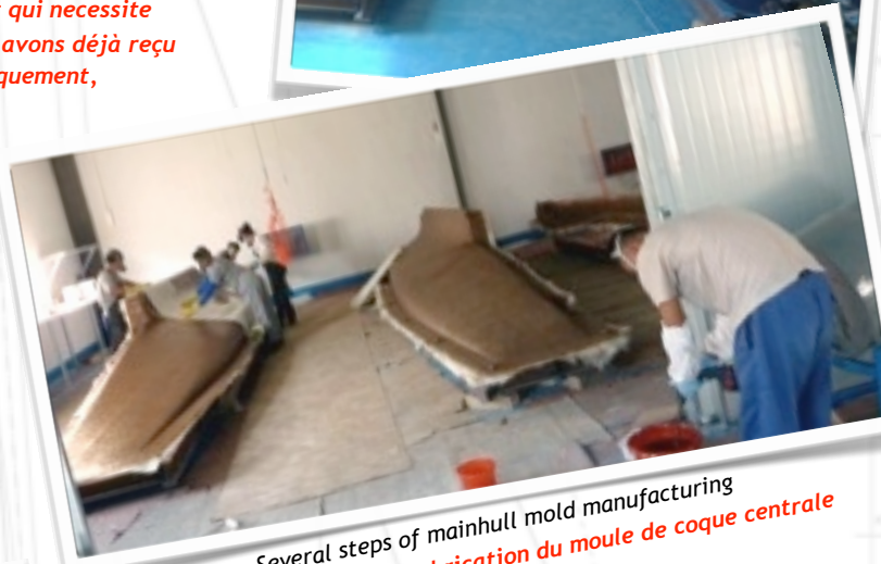
Several steps of mainhull mold manufacturing Différentes étapes de fabrication du moule de coque centrale