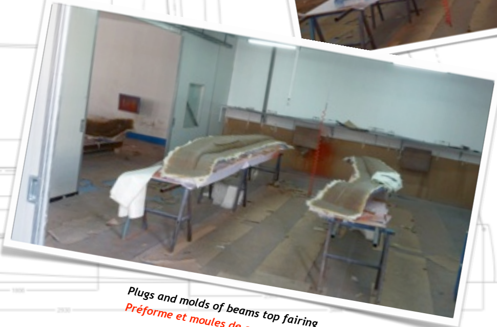
Plugs and molds of beams top fairing Préforme et moules de capot de bras