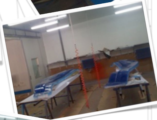
Plugs and molds of beams structure Préforme et moules de carénage de bras